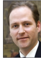
Mag. Clemens Mungenast (Bundesministerium für Finanzen)

Dokumente und textuelle Informationen sind der Treibstoff politischer und administrativer Prozesse. Innovative Ansätze wie die 3-Plattformenstrategie Österreichs mit Bürgerserviceportal Help, Unternehmensserviceportal und Gesundheitsportal